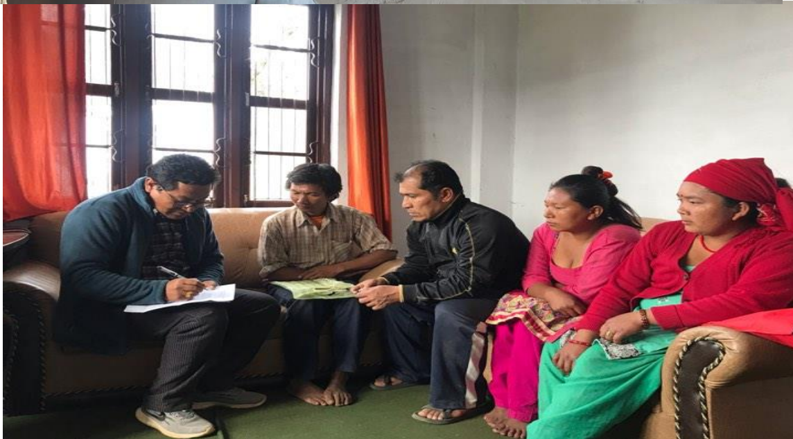
Focus Group Discussion on GESI audit process at Makaising road UG at Gandaki-1, Gorkha