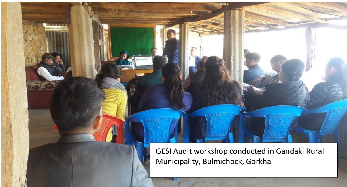
GESI Audit workshop conducted in Gandaki Rural Municipality, Bulmichock, Gorkha